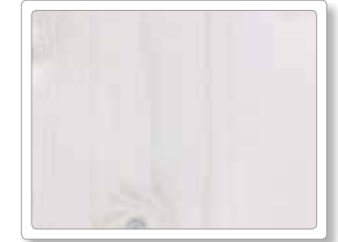
Fichte weiß pigmentiert