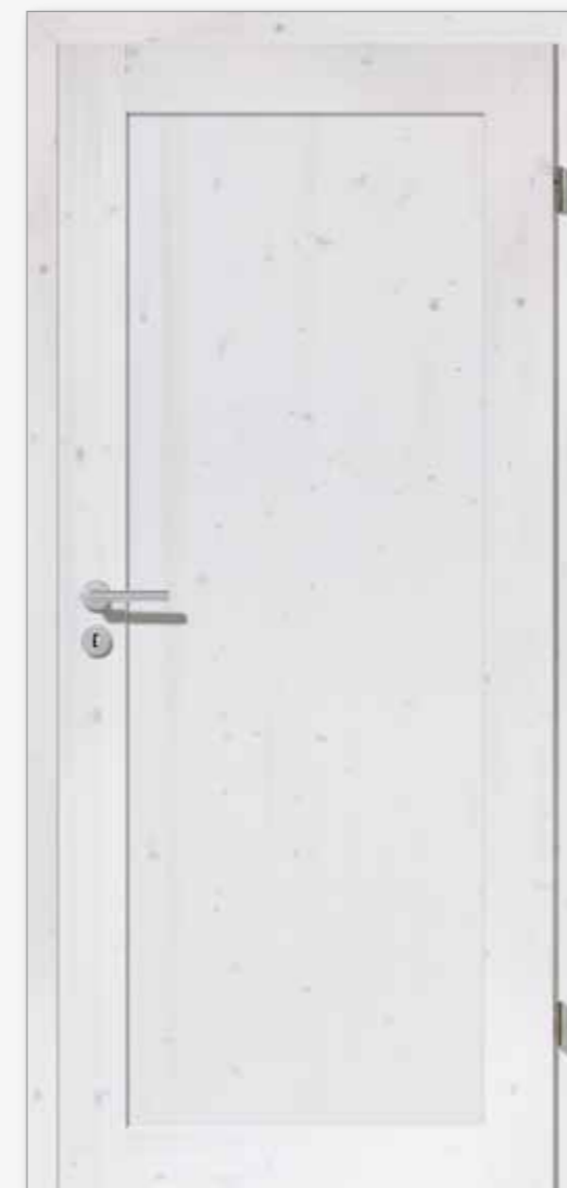
Modell 25/01 Fichte weiß pigmentiert