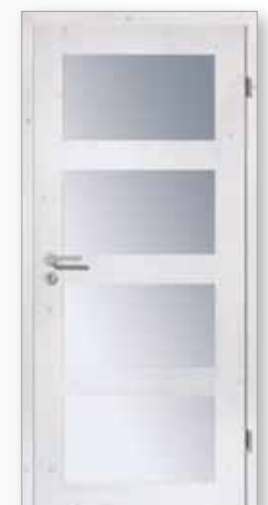
Modell 25/04-LA Fichte weiß pigmentiert