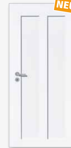
Modell 25/02-S Weiß