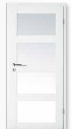
Modell 25/04-LA Weiß

Bei den Modellen 25/01 und 25/02-S können die Füllungen wahlweise mit Schultafellack oder mit einer Spiegeloberfläche veredelt werden.