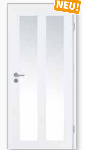
Modell 25/02 LA-S Weiß