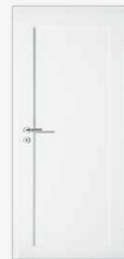
Modell 25/01 Weiß