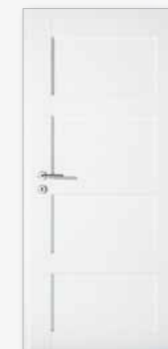
Modell 25/04 Weiß