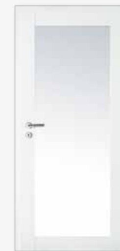
Modell 25/01-LA Weiß