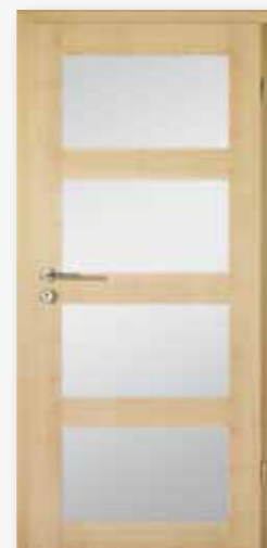
Modell 25/04-LA Dekor Ahorn