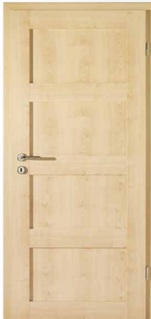
Modell 25/04 Dekor Ahorn