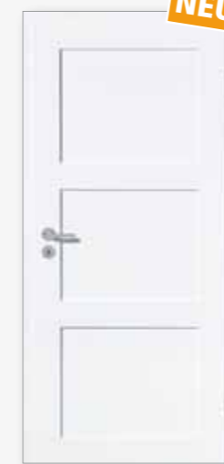
Modell 25/03 Weiß