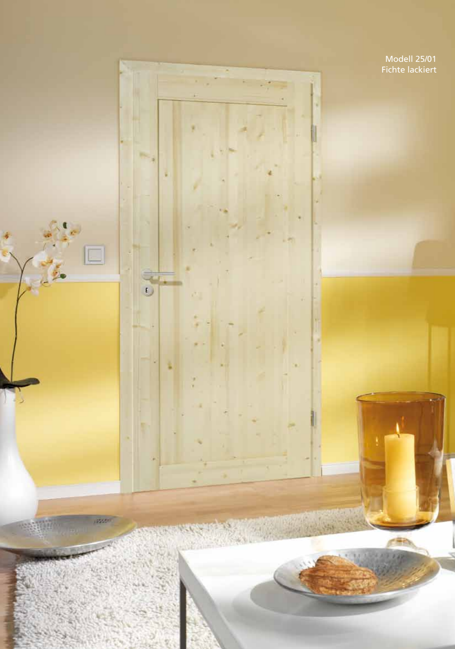
Modell 25/01 Fichte lackiert