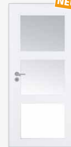
Modell 25/03-LA Weiß