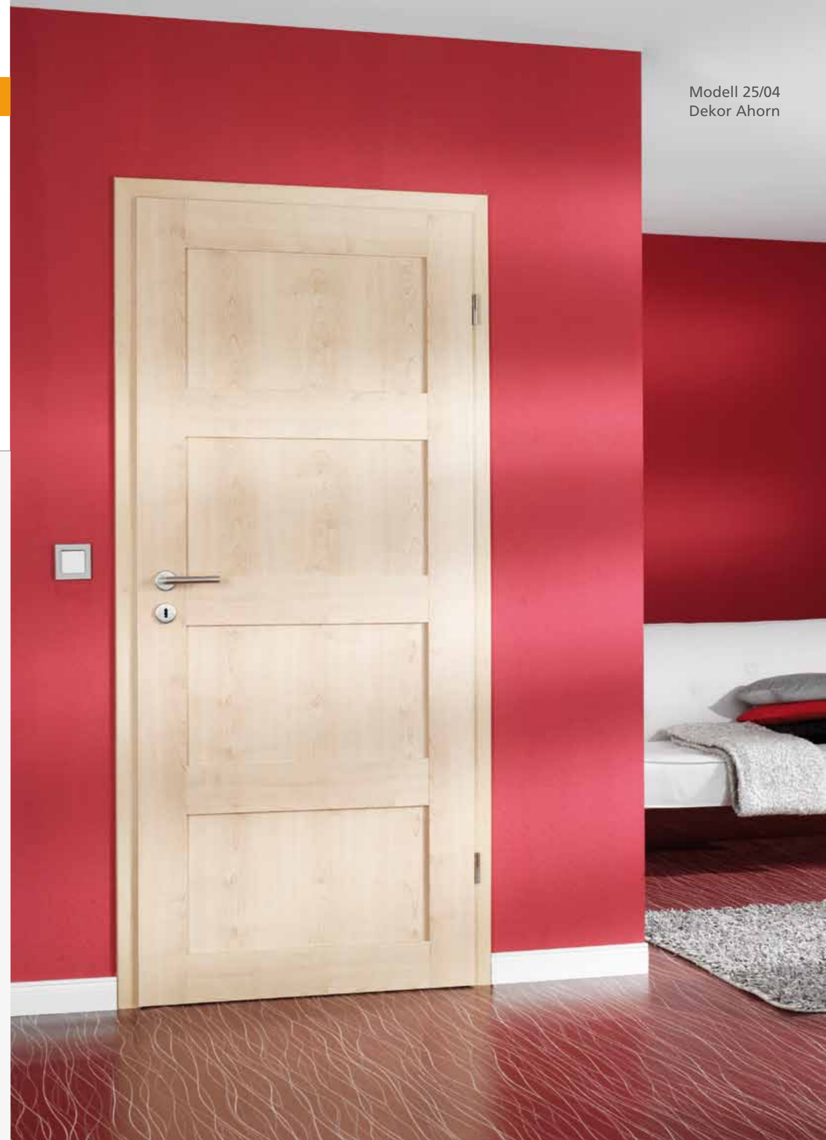
Modell 25/04 Dekor Ahorn