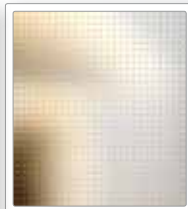
ESG Mastercarré weiß