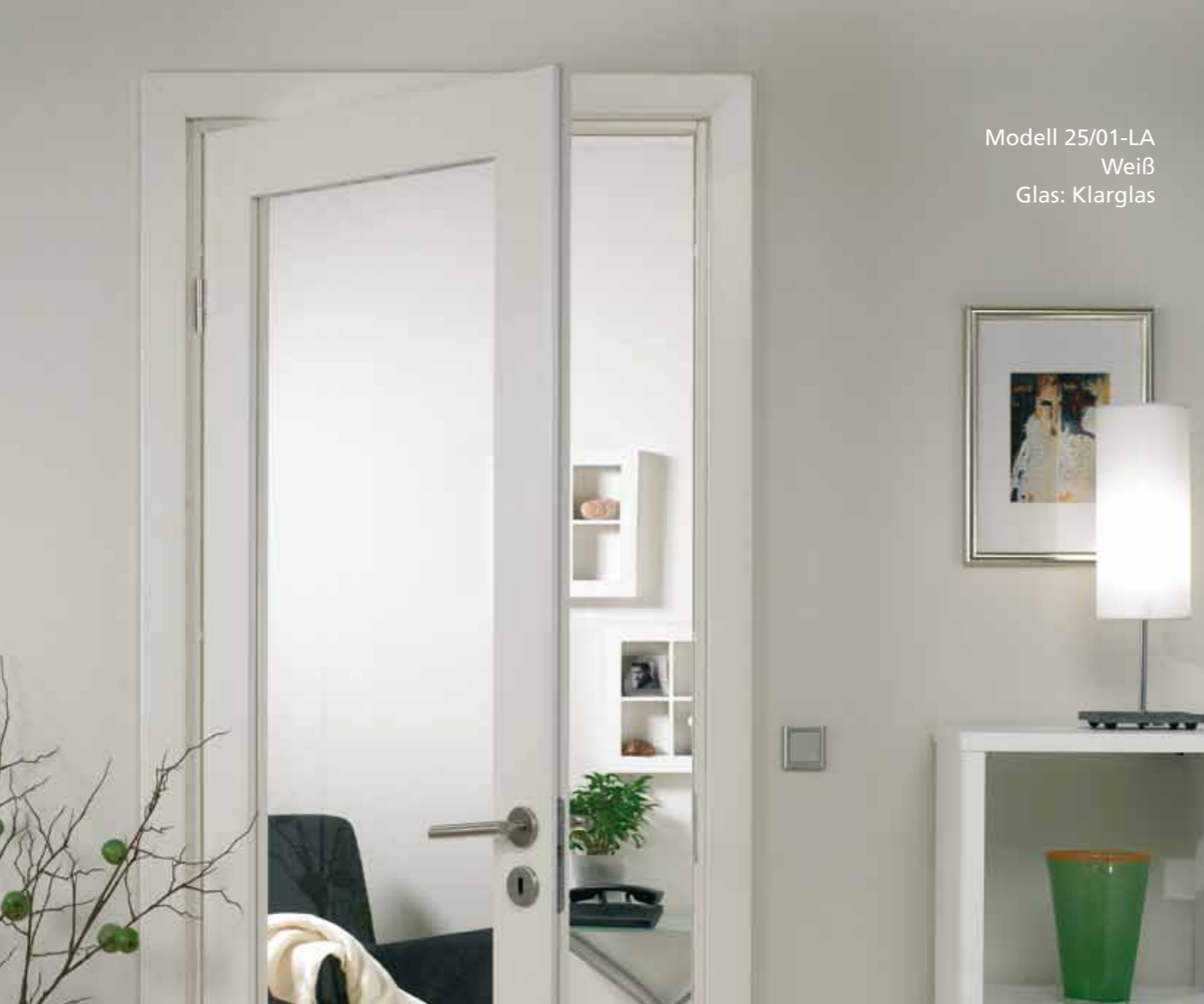
Modell 25/01-LA Weiß Glas: Klarglas