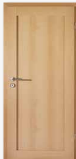
Modell 25/01 Dekor Buche