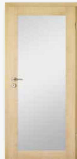
Modell 25/01-LA Dekor Ahorn