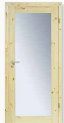
Modell 25/01-LA Kiefer lackiert