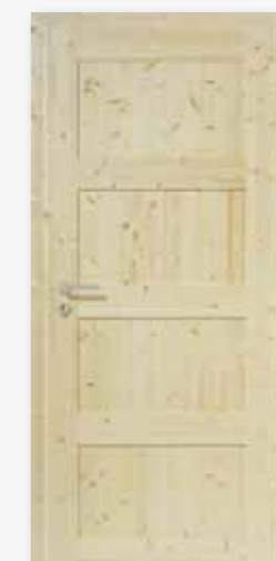
Modell 25/04 Fichte lackiert