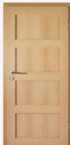
Modell 25/04 Dekor Buche