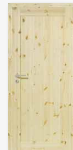
Modell 25/01 Kiefer lackiert